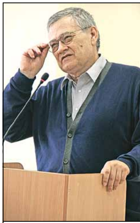
Профессор Георгий Почепцов рассказал о разнообразии техник коммуникации.

- Важно повсюду находить свое место и наслаждаться тем, что есть, - ска-