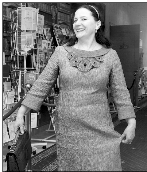
Народная артистка Украины, профессор КНУКИИ Нина Матвиенко призналась, что первой песней, которую спела ее годовалая внучка, была «Крапива ты, моя крапива»