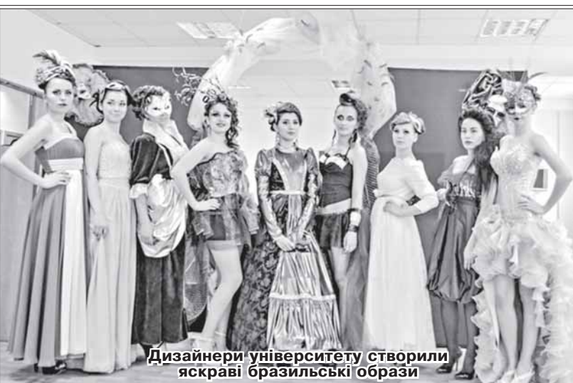
Дизайнери університету створили яскраві бразильські образи

зом із Михайлом Поплавським. Але й вона про сцену не мріє, розповідає: «Мене ще у школі зацікавила робота з документами. Завдяки підготовчим курсам я вступила на спеціальність «Документознавство та інформаційна діяльність» відразу на другий курс, без результатів ЗНО. Від навчання я отримую справжнє задоволення, бо навчається дуже цікаво. А співаю так, більше для душі».