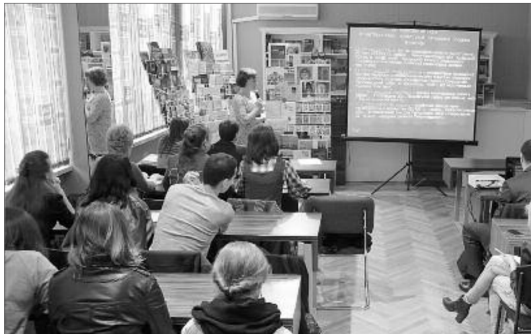
На лекції у науковій бібліотеці КНУКІМу. Ось уже котрий рік цілодобово до послуг студентів — електронна бібліотека КНУКІМу. В її фондах — десятки тисяч книжок і документів.