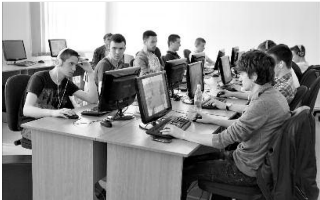
Мультимедійні лабораторії КНУКІМу — це передові комп'ютери новітнього покоління і найновіші версії програмного забезпечення, а також високошвидкісний Інтернет.