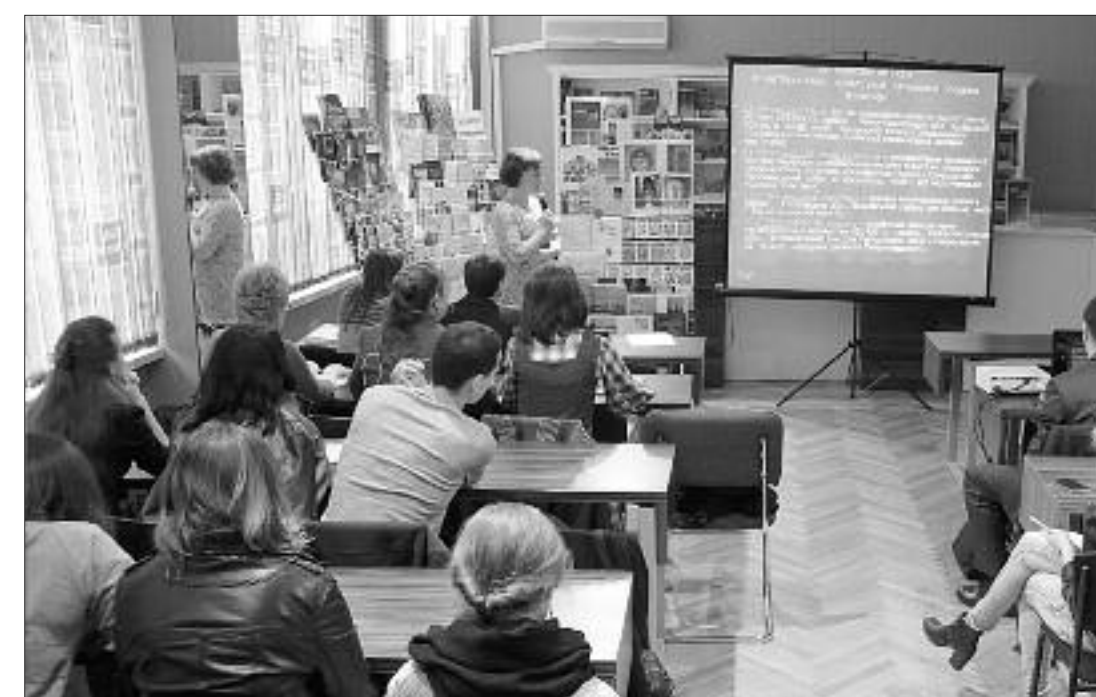
На лекції у науковій бібліотеці КНУКіМУ. Ось уже котрий рік цілодобово до послуг студентів — електронна бібліотека КНУКіМУ. В її фондах — десятки тисяч книжок і документів.